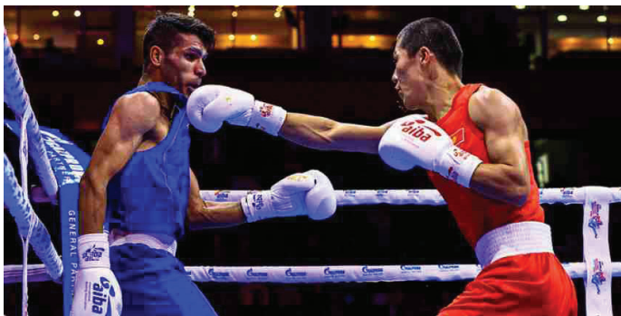
تیم بوکس جوانان ایران نایب قهرمان تورنمنت روسیه شدند؛ و مصباحی ستاره این مسابقات شد.

تیم جوانان بوکس ایران بالاتر از تیم قدرتمند ازبکستان به مقام نایب قهرمانی تورنمنت بین المللی روسیه دست یافت.